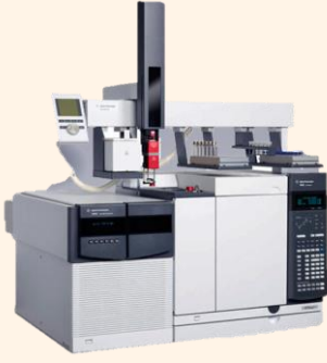
Gaz Kromatografisi-Alev İyonlaşmalı Dedektör (GC-FID)