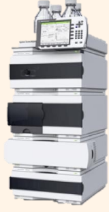
Gaz Kromatografisi-Kütle Spektrometresi (Head Space) (GC-MS) (HS-GC/MS)